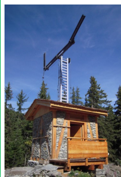
Plan de l'Ours.

Animations proposées : animations communes aux trois sites télégraphiques du Plan de l'Ours à Saint-André, du Courberon à Avrieux et du Mollard-Fleury à Sardières-Val-Cenis. Échanges de messages à 11 heures et 15 heures. L'explication du système de codage est prévue une demi-heure avant chaque vacation.